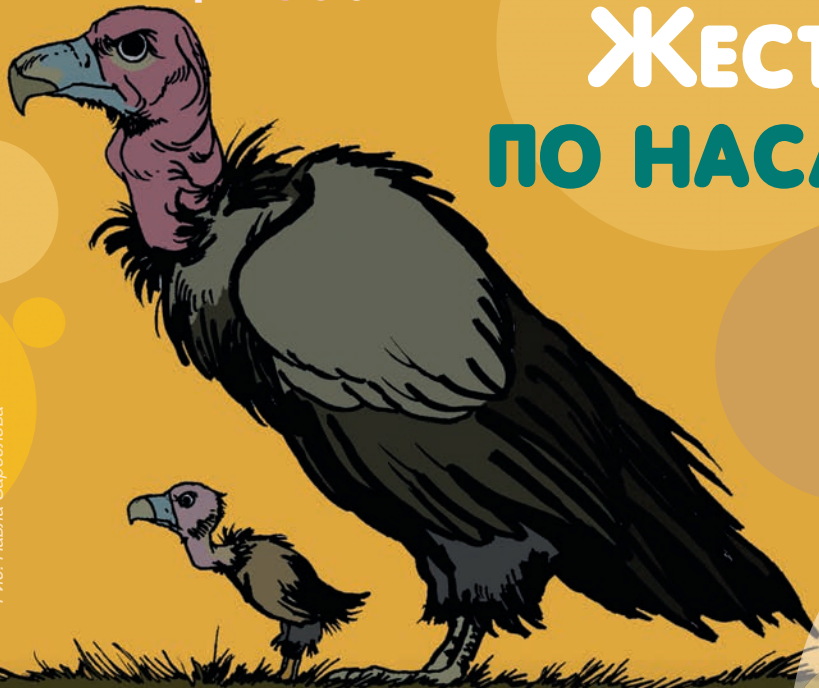
Рис. Павла Зарослова

Для некоторых родителей сила – единственный метод воспитания. Неосознанно мы растим детей так, как растили нас. В поколениях копируем радость и уважение, жестокость и равнодушие, и нужна большая сила воли, чтобы переставить семейный поезд на другие рельсы.